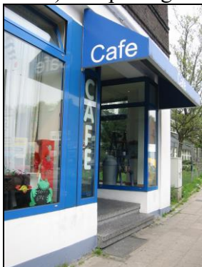
Café Westenfelder Str. 90

Noch tiefer greift eine zweite Veränderung: Der Landschaftsverband Westfalen-Lippe nimmt die Tagesstätte der BRÜCKE nach Ablauf des fünfjährigen Modellprojekts in seine Regelförderung auf. Die Auswertung des Versuchs stellt den Tagesstätten gute Noten aus: Die notwendigen psychiatrischen Krankenhausaufenthalte waren bei 88 Prozent der Besucher kürzer geworden oder ließen sich vermeiden. Dank der Tagesstätten-Betreuung rechnet der Landschaftsverband mit einer Kostenersparnis von jährlich 6 Mio. DM (3 067 775 €) durch die geförderten Tagesstätten. Rechnerisch entfielen 300 000 DM (153 388 €) Einsparung auf die BRÜCKE.