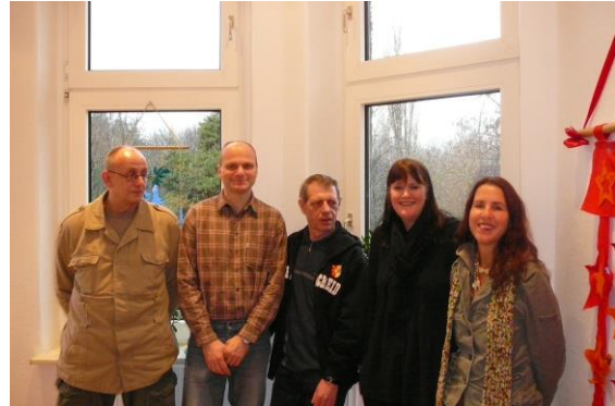
Das Mitarbeiter-Team 2009.

Am 10. Juni findet zum ersten Mal ein „Tag der Offenen Tür“ im Frühjahr statt, er wird trotz kühlen Wetters ein Erfolg.