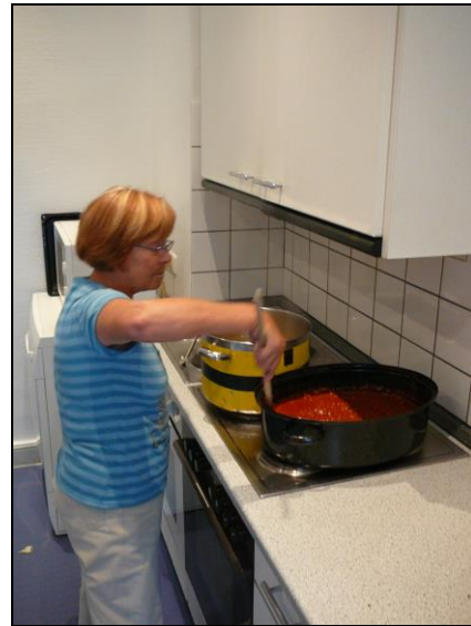
In einer der BRÜCKE-Küchen

belegt die Ergotherapie der Tagesstätte, im Keller können Besucherinnen und Besucher in der Holzwerkstatt arbeiten.