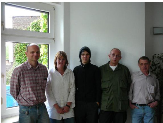
Das Mitarbeiterteam 2007

2003: Das BRÜCKE-Haus, eine Gründerzeit-Villa aus dem Jahr 1902, wird sorgfältig renoviert und den Bedürfnissen der Besucherinnen und Besucher angepasst. Das Café-Projekt der BRÜCKE wird weitergeführt. Der Verein mietet eine Cafeteria im Berufsschulzentrum von der Stadt Bochum an und eröffnet am 15.09.2003 den Betrieb. Von Anfang an sind viele Besucherinnen daran interessiert, an diesem Arbeitserprobungsprojekt der Kontakt- und Beratungsstelle mitzuarbeiten. Im Schichtdienst sind bald um die zwölf Mitarbeiterinnen tätig. Schülerinnen und Schüler der Berufsschulen akzeptieren sehr rasch die psychisch Behinderten, die ihrerseits ihre soziale Rolle im Alltagsgeschäft finden. So öffnet sich die BRÜCKE nach außen. Die Cafeteria wird mit steigenden Umsatzzahlen zur Erfolgsgeschichte.